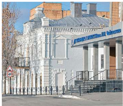
Новоселье в ДШИ № 2 ▶ 21