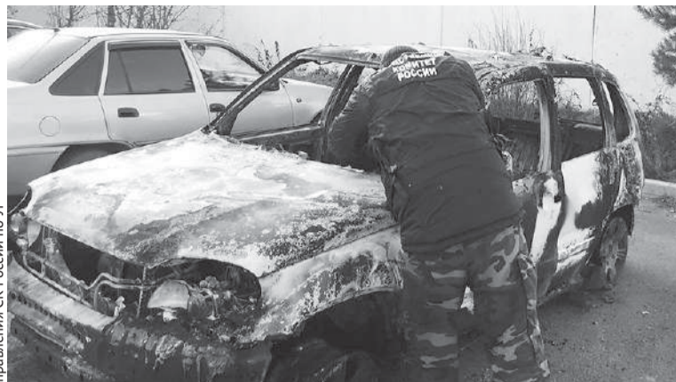
Следователи осматривают сгоревший автомобиль.