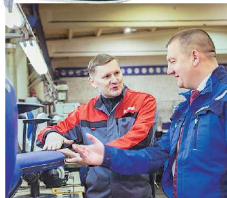
Бережливый «Авангард» ▶ 4